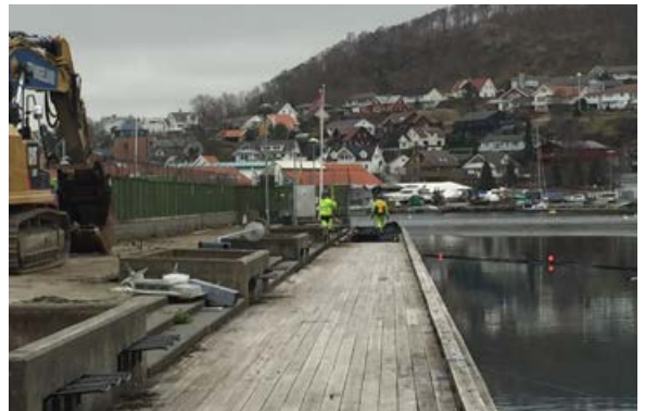
Her skal det bli ny fin kai.