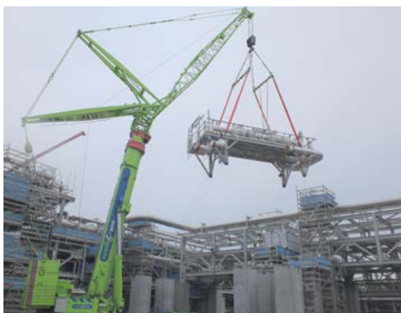
500 t, Aukra.

så vil maskinparken ha fått tilført 12 nye kraner som gjør oss enda mer konkurransedyktige i et tøft marked.