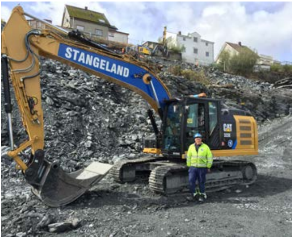
Espen Vigre, Cat 323 EL.