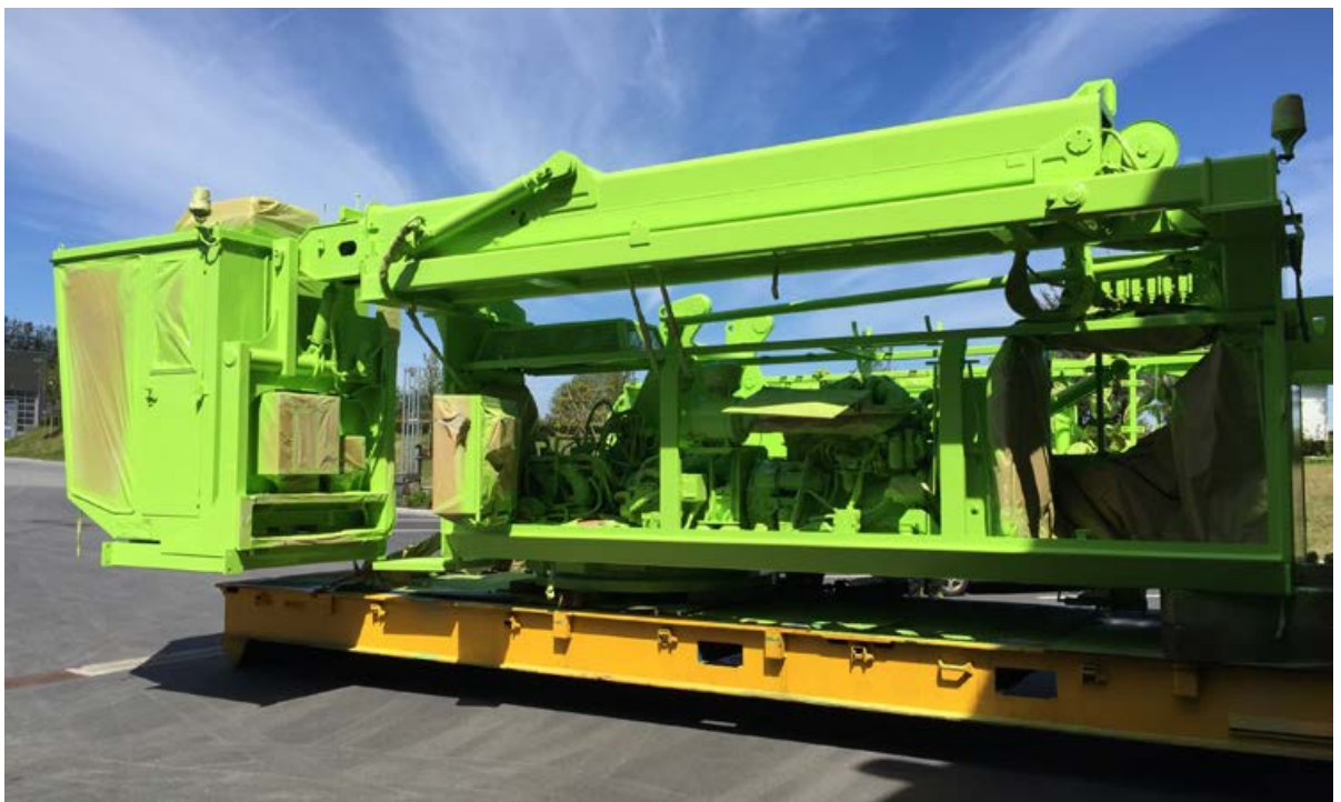
Overvogn fra lakkering.

Jeg vil med dette ønske alle våre ansatte, kunder, venner og bekjente en riktig fin sommer. Ta godt vare på dine og deg selv!