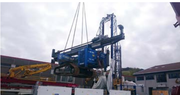
Heising av rigg fra boredekk»