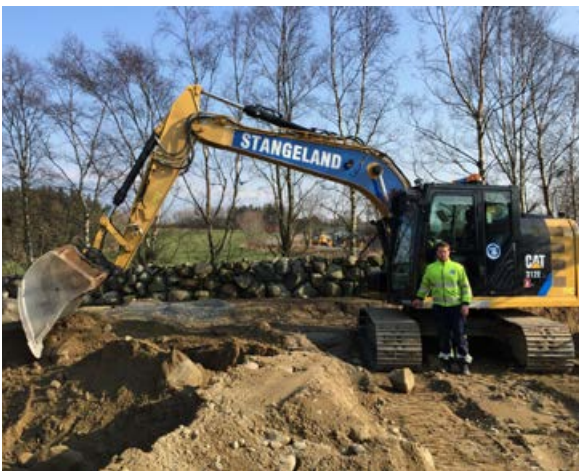
Ingvar Myklebust, Cat 312 EL.