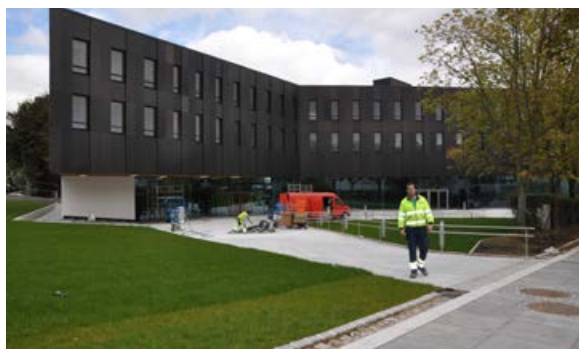
SV-bygget på Ullandhaug.