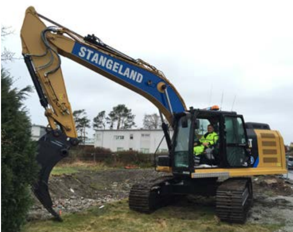
Peder Ueland, Cat 320 EL.