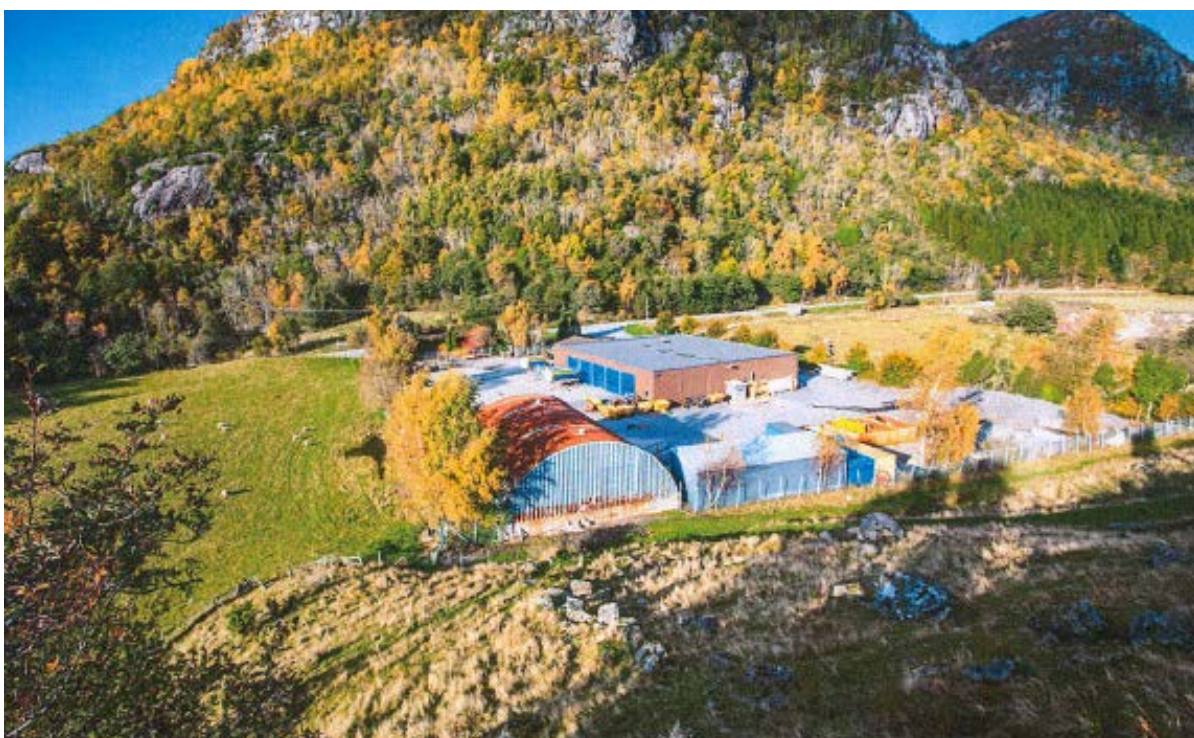
Stangeland Gruppen AS kjøpte denne industrieiendommen med lager, verksteder og kontor på Tau i 2014. Tomten er ca. 9,3 mål.

Ønsker alle en GOD og varm SOMMER (verre enn mai kan det ikke bli).