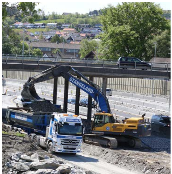
Lasting på Schancheholen.