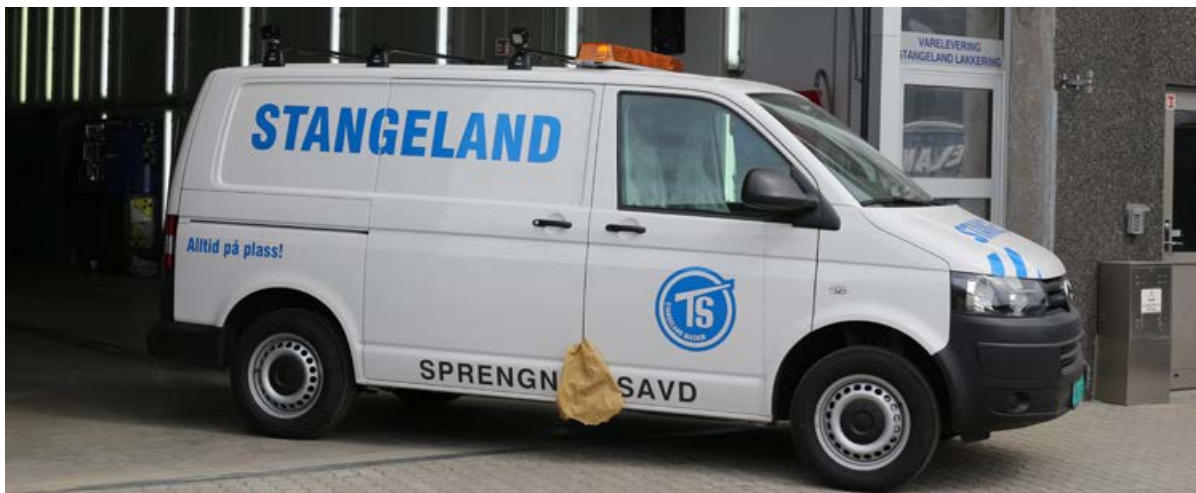
Ny bil til Sprengningsavdelingen, vi monterer dekor og siste finish før den skal i drift.