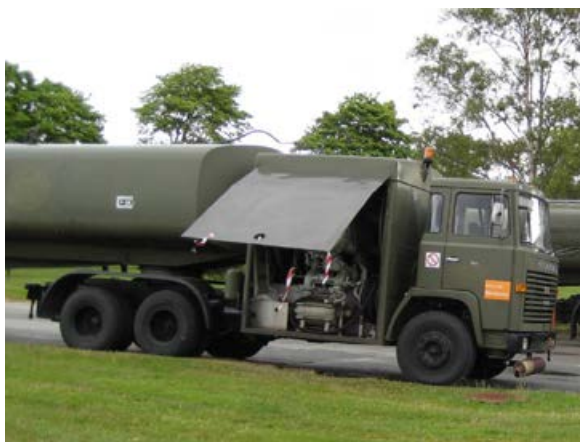
Scania 110 hos Forsvaret.

Tankutstyret ble fjernet og bilen ble sendt en tur til Danmark, der innredningen ble restaurert. Det utvendige ble restaurert hos Stangeland's verksted på Soma, der bilen ble lakkert om i firmaets farger.