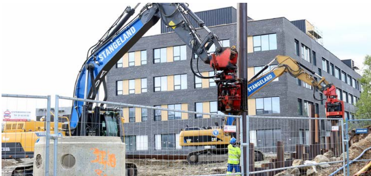
Parkeringshuset ved Forum Jæren på Bryne. Det er effektivt når fundamenteringsavdelingen spunter med to gravemaskiner samtidig.

Etter en travel og god vinter går det nå mot sommer. Benytt sommerferien til å slappe av og samle krefter til en travel høst. GOD SOMMER TIL ALLE!