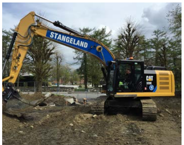
Tor Amstein Ånestad, Cat 320 EL.