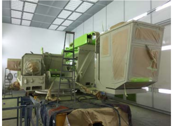
Overvogn til lakkering.

Vår Sennebogen 6120 HMC er for tiden inne til full oppgradering, rutinemessig vedlikehold og lakkering, og med dette er vi sikre på at denne kranen skal gi oss mye glede fremover. Selve oppgraderingen blir stort sett utført av egne mekanikere. Jeg vil benytte