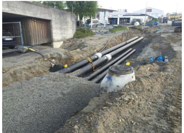
Fjernvarme og fjernkjølerør fra Lyse.