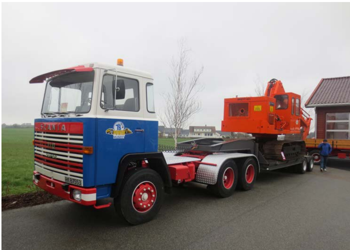
Scania LBS 110 hos Stangeland Maskin.