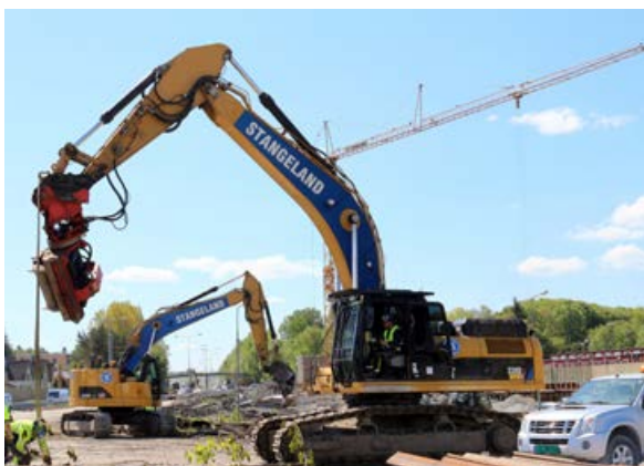
Maskin med spuntaggregat, Kiellandsmyra.

Tunnelarbeidene går godt fremover, og det er til nå produsert nesten 3,5 km med tunnel. Det drives med 5 borrygger, og daglig sprenges og kjøres minst 5.000 tonn med stein til Jåttåvågen. Det er nesten 200 billass hver dag.