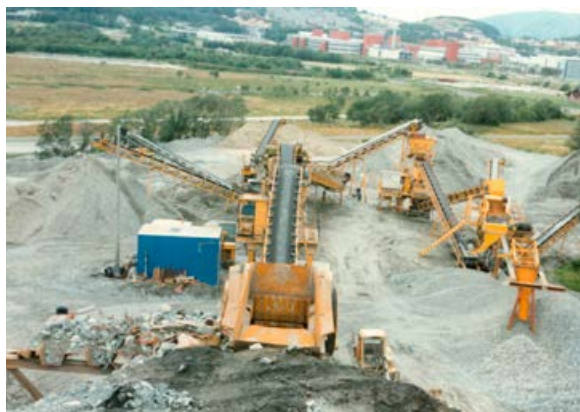
Pukkverket til TS-en på Forus i 1985-86.