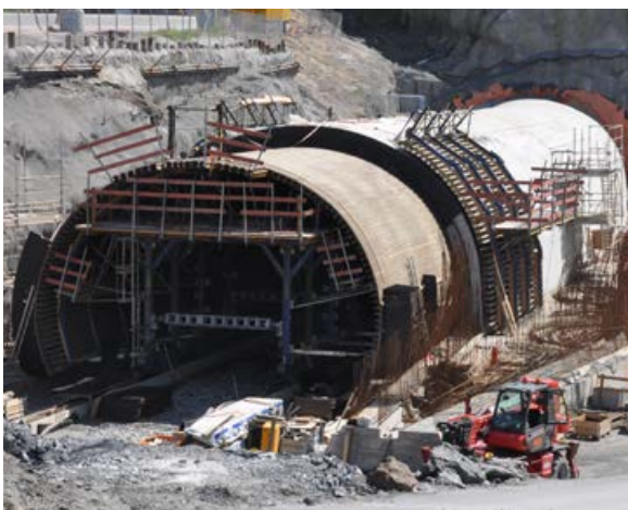
Den ene tunnelportalen på Tasta er snart ferdig.

På Tastasiden har vi nå sprengt oss under Byhaug-tunnelen med bare 3 m mellom eksisterende vei og den nye tunnelen. I fjor sommer forberedte vi dette og