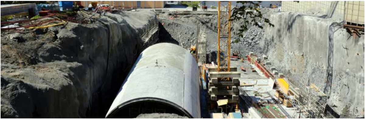
Tunnelportal til Hundvågtunnelen.

støpte 2 kraftige betongbruer inne i den gamle tunnelen. Så nå viser disse betongbruene i hengen i de nye tunnellopene akkurat som planlagt.