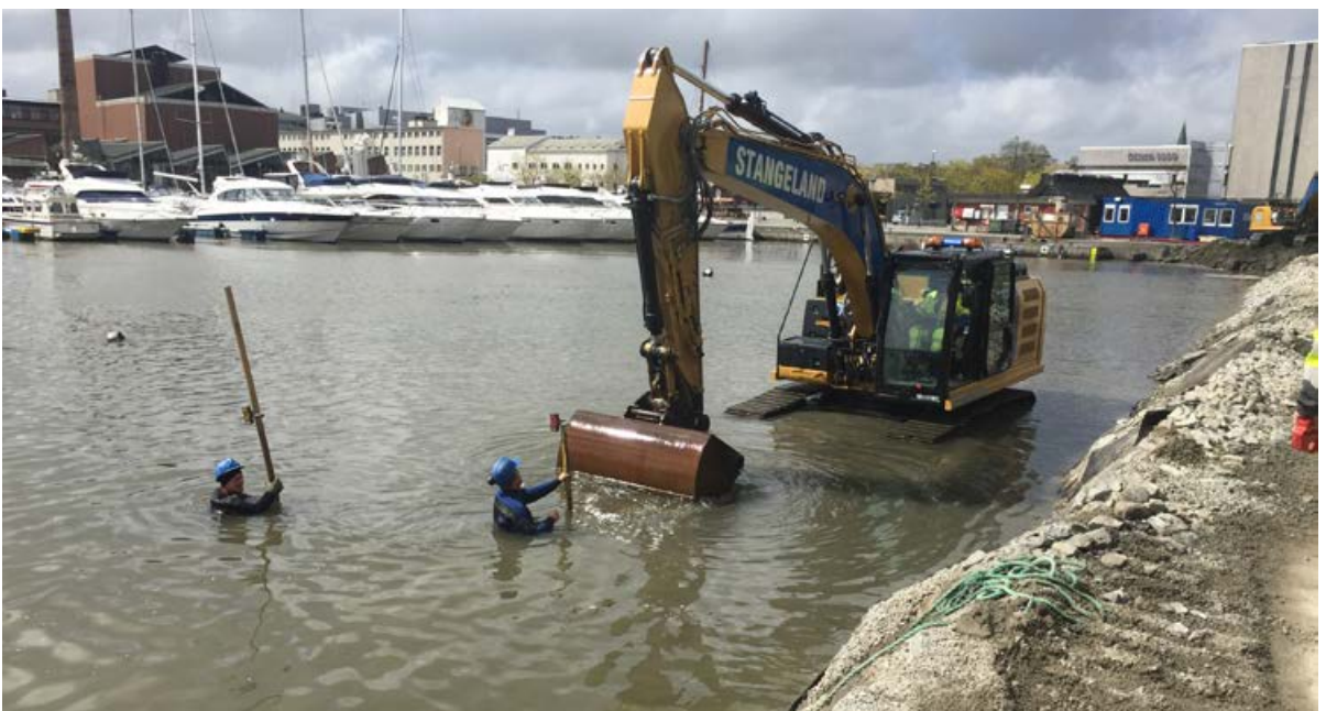
Finplanering i sjø.