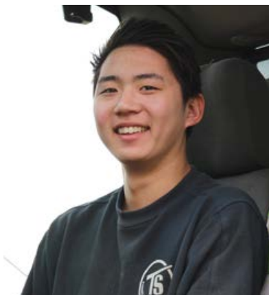
18 år og lærling i maskinførerfaget