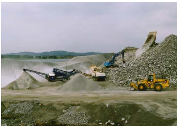
Mosterøy i 1991.