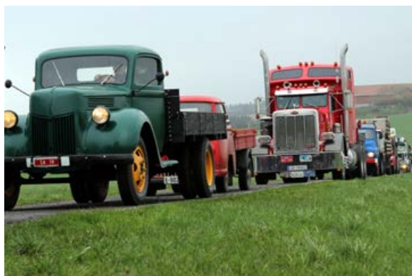
Kortesjen på vei inn til TS Museet på Tjelta.