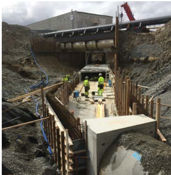
Kulvert på Langevatn.