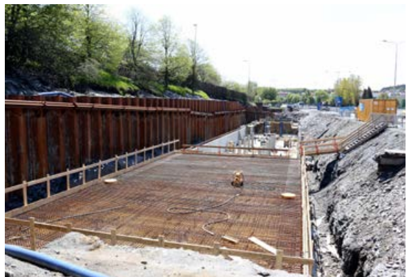
Fordrøyningsbasseng for overvann, Schancheholen.