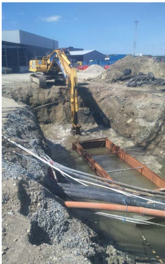
Frå arbeidet vårt på Norsesea-basen i Dusavik.