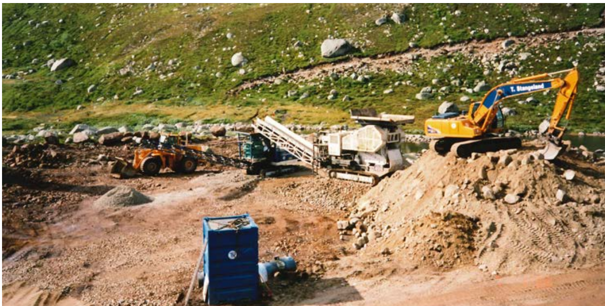
Flørli i 1998.

Det er nok mange historier frå den tida, eg minnest oppstarten av Rennfast. Dette var eit samarbeidsprosjekt med TS, Krusen og B&G, så det var mange som vart prosjektansatte, men dei var ikkje kome til anlegget då Krusen starta på tunellen i Harestadvika. Olav kom til meg og spurte om eg kunne reisa inn til Harestadvika og laste litt stein. Eg reiste inn der og lasta, men det var ikkje litt som skulle lastas. Dette var skiftarbeid, og eg lasta då på begge skifta, var og med å lada «salvå», eit interessant og lærerikt arbeid. Men det vart litt timer av dette, når salva gjekk 2-3 om natta, lasta eg til 06.00 og då var det eit nytt skift og eg var i gang att. Eg måtte til Solvig