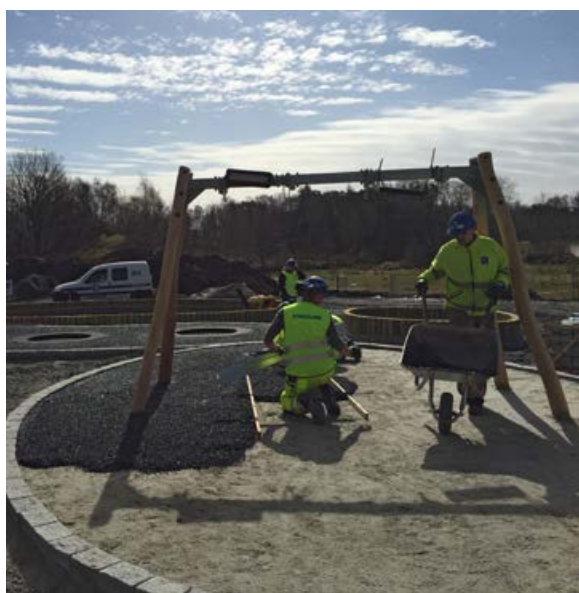
Legging av gummibelegg, Emmaustunet.

Det siste året har gartneravdelingen tatt på oss flere oppdrag med rehabilitering av uteområder både på skoler og barnehager. I juni startet vi opp både på Kvernevik og Madlamark skole, dette er prosjekt for Stavanger kommune som skal ferdigstilles før skolestart til høsten. For Sandes kommune skal vi utbedre utendørsanlegg på Sandvedhaugen barnehage. På