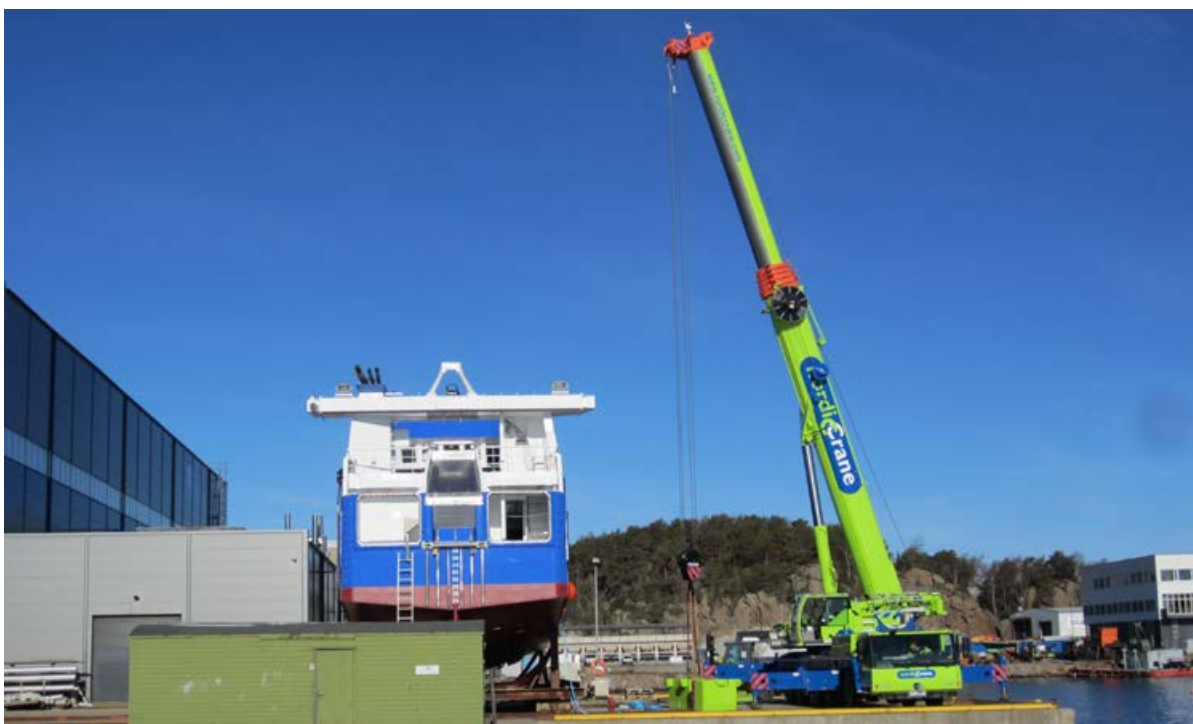
Nordic Crane forbereder seg til løft på Sørlandet.

Med ønske om en god sommer til alle. Bruk ferien godt til avslapning, familie og glede.