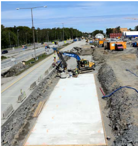
Fundamentering for mjølkulverten.

Av Sverre Nergaard, prosjektleder i Stangeland Maskin og assisterende prosjektleder i JV Bilfinger Stangeland.