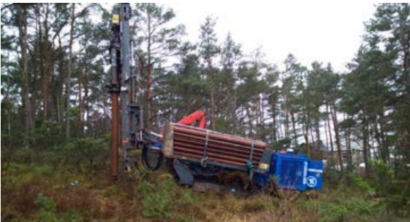
Her er vi klare til å bore vannbrønn på Kalvøy

Vannbrønner har det også vært en del av til nå i år, og vi håper det kommer flere. Vi har blitt mer kjent med Sørlandet der vi nettopp har levert 4-5 vannbrønner.