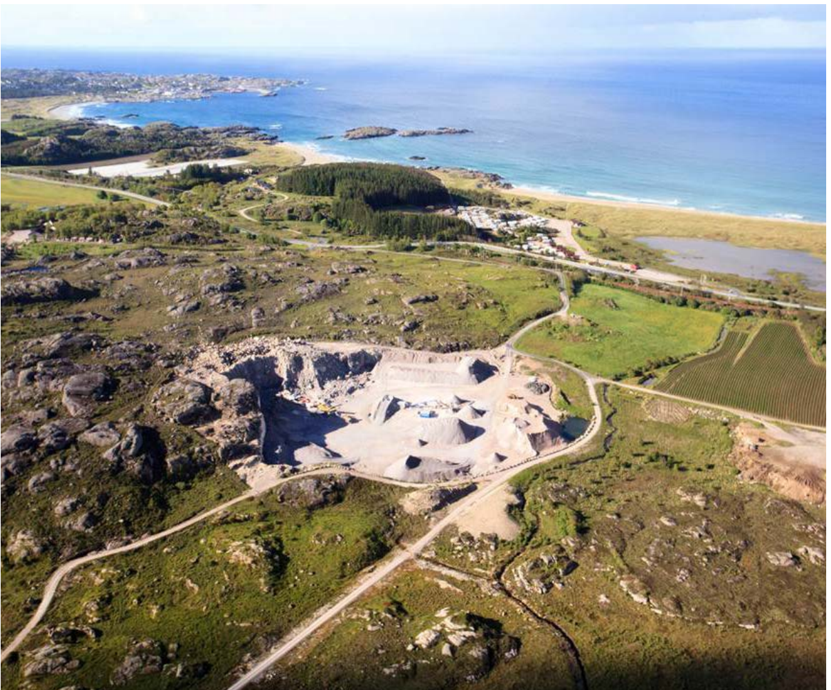
Pukkverket vårt på Ogna.