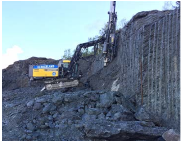
Sømboring for tunnelportal Schancheholen.

Til nå er det utfyllt mer enn 500.000 m 3 med fjellmasse i de gamle tørrdokkene der Gullfaks- og Oseberg plattformene i sin tid ble bygd. Dette tilsvarer 33.000 billass, og alt går iht. planen.