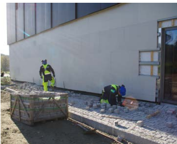
Setting av smågatestein, SV-bygget UiS.