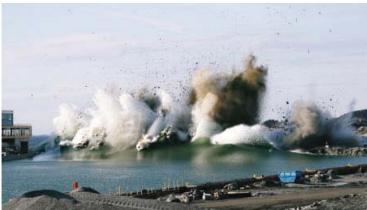
Flodbølga går ved sprengning av barrieren i Risavika Havn.

“TS har betydd mye for å komme i mål med alt. Jeg er imponert over både selskapet og den enkelte ansatte”