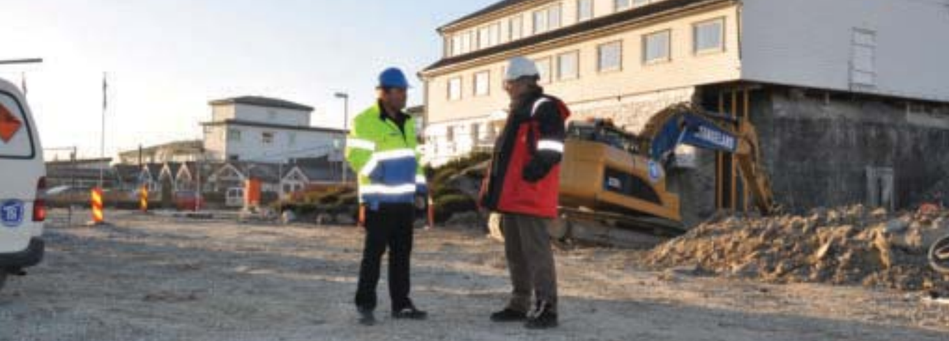
Her har vi nok et prosjekt for Backe Bygg - utvidelse av Sola Stand Hotel.

mettet filmsulten min. Fotografering og billedbehandling er glødende interesser og kan ta mye tid. Ellers prøver jeg å spille golf og squash og har gjennom mange år på fly klart å vedlikeholde min store appetitt på litteratur, gjerne et par bøker i uka. De siste årene har jeg kjøpt meg hytte på Idse, en av mine beste investeringer i livet! Fra påske og til utpå høsten brukes den og båten flittig og jeg har funnet mitt paradisi der, i nærhet til gamle og gode kolleger fra byggebransjen. Her får jeg også utløp for mine amatørkunster innen snekkerbransjen.