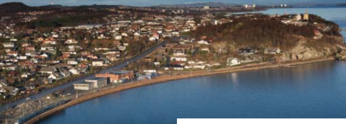
Fint luftbilde av Luravika.