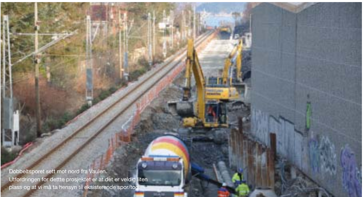
Dobbeltsporet sett mot nord fra Vaulen. Utfordringen for dette prosjektet er at det er veldig liten plass og at vi må ta hensyn til eksisterende spor/toc

I denne utgaven av TS-nytt kan du lese mer om HMS-satsingen. Vi er underveis, arbeidet går bra og viktigst av alt: Tiltakene viser igjen på statistikken. De faste onsdagsrundene gjør meg både stolt og ydmyk. Folk tar budskapet på alvor og er topp engasjerte. Det er slik vi vil ha det – det er slik vi blir best i bransjen!