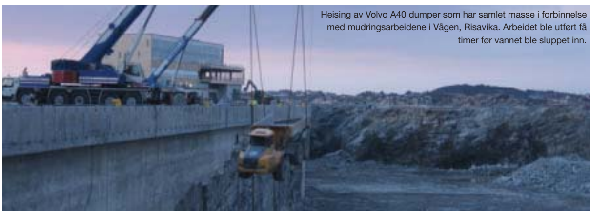
Heising av Volvo A40 dumper som har samlet masse i forbindelse med mudringsarbeidene i Vågen, Risavika. Arbeidet ble utført få timer før vannet ble sluppet inn.

Vil til slutt nytte anledningen til å takke for fine gaver og blomster i anledning min 50 års dag, som jeg var så heldig å få starte feiringen av på vår innvielses- og jubileumsfest.