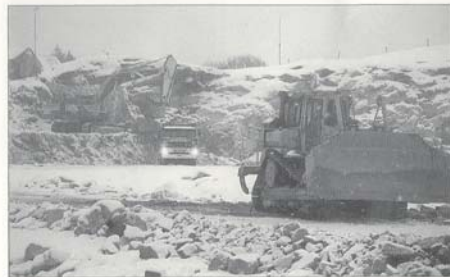
Vinterstemning på Halliburton, Aker Base, Tananger.