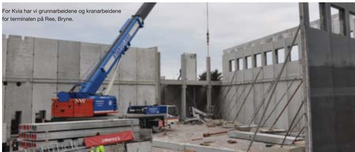
For Kvia har vi grunnarbeidene og kranarbeidene for terminalen på Ree, Bryne.