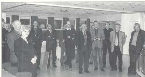
Gjestene stod i ring rundt de mange gode talerne.