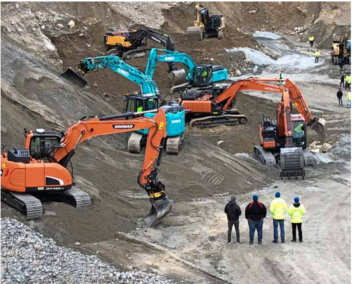
Det var god anledning til å prøve gravemaskiner.