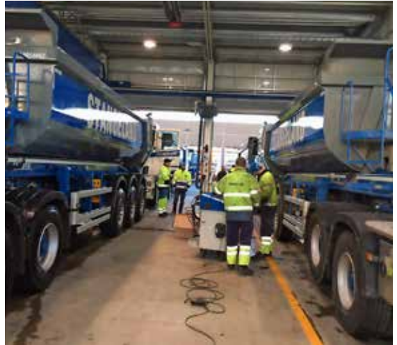
Stor aktivitet i hallene på Soma.

H vert år i januar samler vi alle lastebiler og hengere på Soma for avlesing av kilometer og måling av mønsterdybde på dekk. Bil og Anleggsdekk står for dette. Samtidig skifter våre mekanikere hydraulikkfilter på alle bilene. Lastebilleverandørene stiller med biler for prøvekjøring. De har også med «give-aways» som vi har loddtrekning av. Dette er en nyttig, sosial og kjekk dag med godt faglig drøs mellom sjåførene og leverandørene. Takk til alle som stiller opp og gjør dette til en god fagdag!