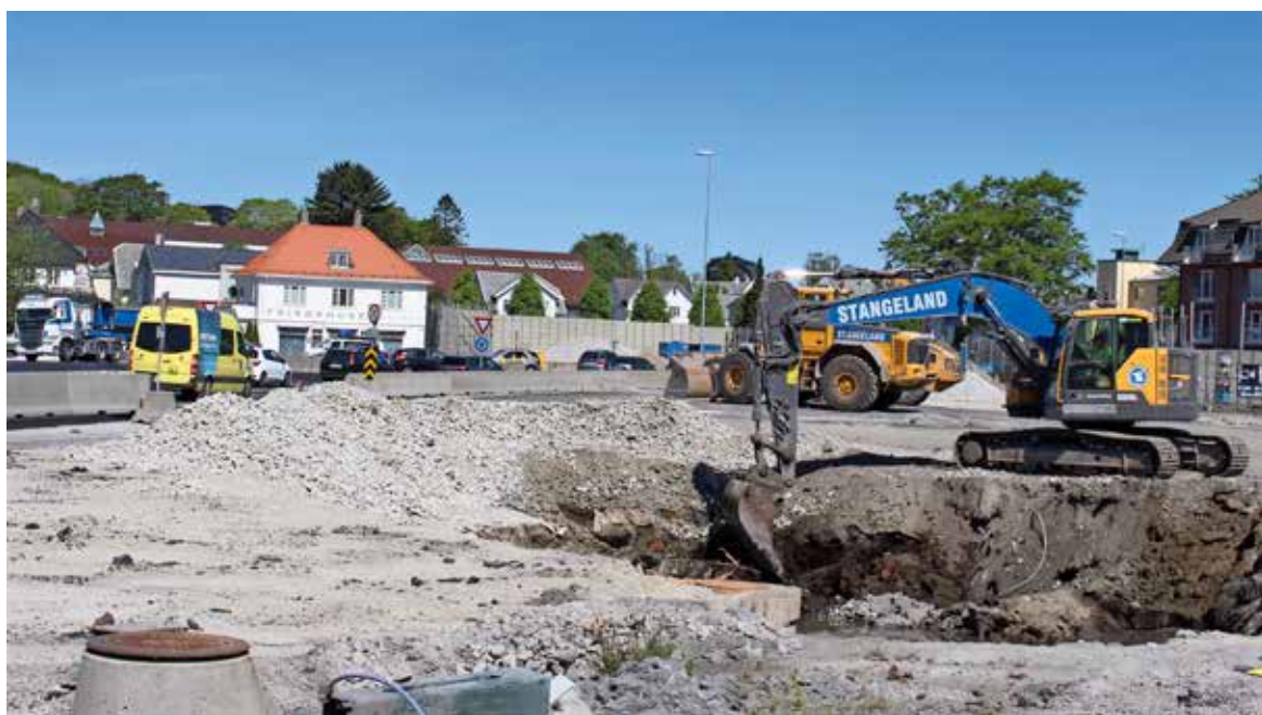
I over 4 år har gjengen på prosjekt Eiganestunnelen hatt arbeidsplassen sin i et svært trafikkert område. Bildet er fra området ved rundkjøringen Madlaveien – E39. Svithunparken bak i bildet.