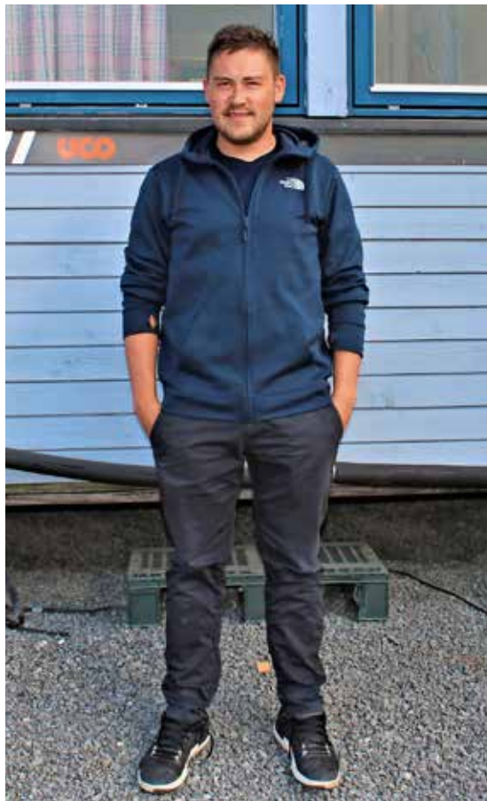
Prosjektingeniøren vår foran kontorbrakka i Bjerkreim vindpark.