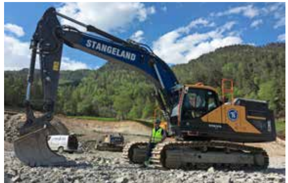
MAGNUS SØMME, VOLVO EC 380 EL