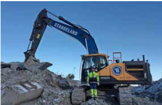
PÅL BORE, VOLVO EC 300EL