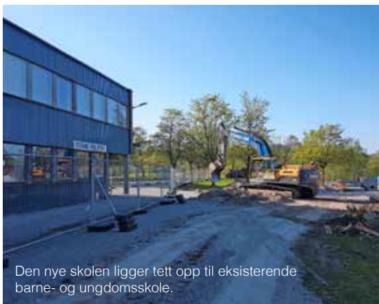
Den nye skolen ligger tett opp til eksisterende barne- og ungdomsskole.