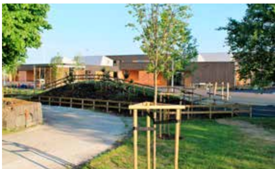
Grønt og fint i skolegården på Ogna skule.