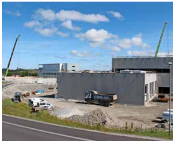
Stangeland Næringspark i juni 2018. Bil og Anleggsdekk fremst i bildet. Ahlsell-bygget reises foran Archer-bygget til venstre i bildet.

Utenom nevnte prosjekter har vi til enhver tid flere større og mindre prosjekter pågående rundt omkring. Kan blant annet nevne Kongeparken som år etter år viser oss tillit til å utføre graving for deres nye attraksjoner.