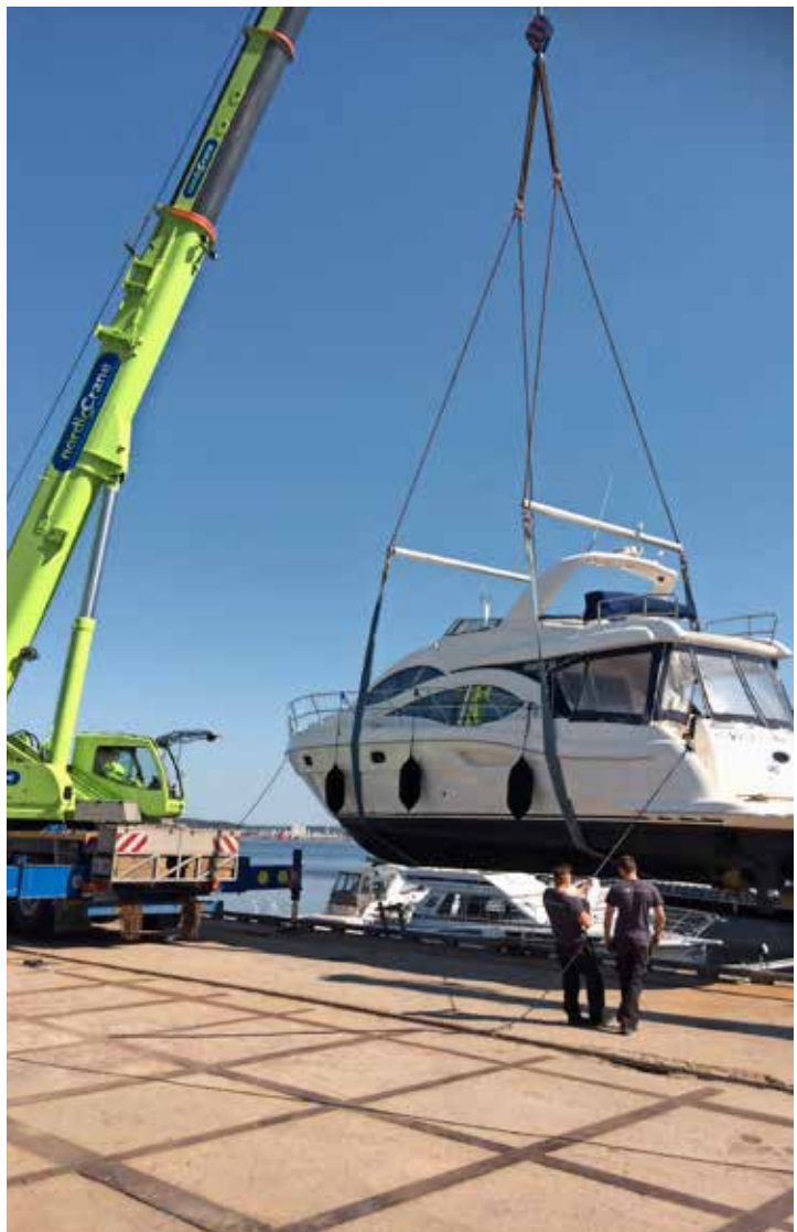
Mye godt arbeid for oss i Sør når alle de flotte båtene skal ut på sjøen.

Vil herved takke våre samarbeidspartnere, leverandører, kunder og ansatte for alt som har skjedd denne våren, og ønske alle en god og varm sommer.