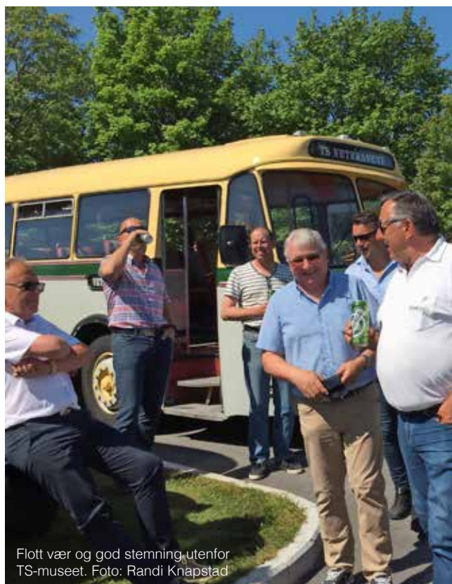
Flott vær og god stemning utenfor TS-museet.