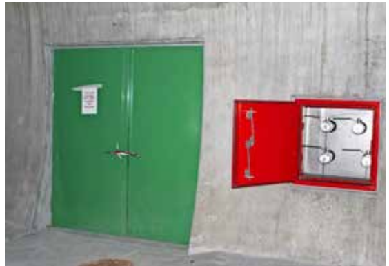
Grønn dør inn til teknisk rom og rødt brannskap.