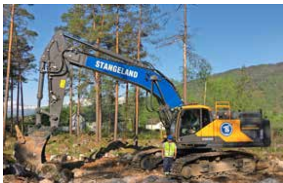
EIVIND SØRENSEN, VOLVO EC 480 EL