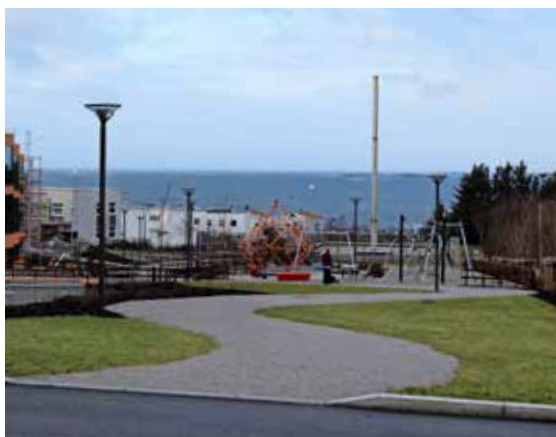
Se så flott det har blitt på Myklebust. Her har vi vært med på forskjellige oppdrag i over 6 år.

Grøft for fjernkjøleledninger på Forus, her er vi hovedentreprenør for Lyse Neo. Det skal graves cirka 1000 m grøft for 2 500 mm kjølerørledninger samt medfølgende stikkledninger, kabler og trekkerør i eksisterende grøntarealer og veier. Det skal også borres for og trekkes to strekk som totalt er cirka 220 meter med 2 stk 500 mm og 1 stk 160 mm for kryssing Forusbeen samt under Åsenveien/Foruskanalen. Her er det dypt under terreng, på det laveste punktet 10 meter. Boringen utføres for oss av Torbjørn Reime Maskin. Peder Espedal er vår driftsleder på plassen. Fjernkjøling er nytt produkt fra Lyse Neo der hensikten er å levere kaldt vann for diverse kjøling i kontor og industribygg. Dette skal ha en energisparende gevinst sett mot tradisjonelle kjølemetoder.