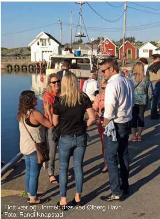
Flott vær og uformelt drøs ved Ølberg Havn.

og utdeling av heder og ære. Formålet til foreningen er; å ivareta medlemmenes fellesinteresser, samt virke for gode og varige forhold mellom foreningens medlemmer innbyrdes.