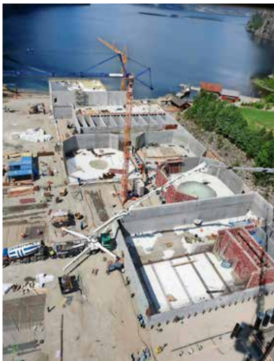
Mange betongkonstruksjoner på Tytlandsvik Aqua.

gamle GMC-tomten. Stikningsingeniør Rune Åsnes har så langt fulgt prosjektet i 2 ½ år med bygging av infrastruktur, næringsbygg og flere boligblokker. Han gjør stikningsarbeid både for planlegging (GMC), prosjektering (Dimensjon/Sveco), graving, pelling, montering, støping og dokumentasjon.