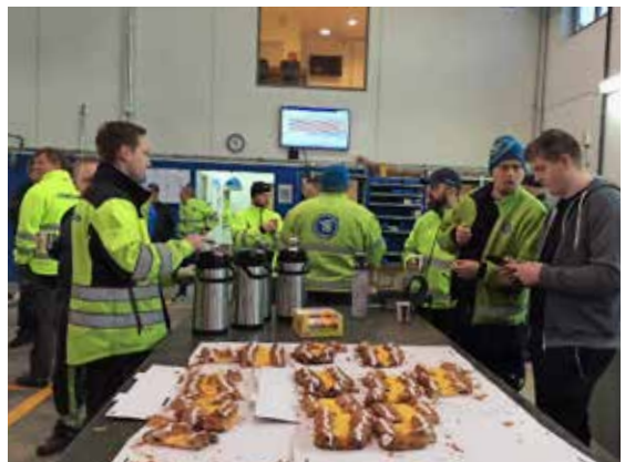
Viktig med gode wienerbrød og kaffi.