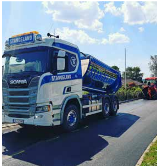
Asfaltlegging på Mariero.