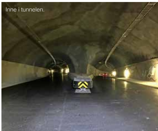
Inne i tunnelen.

Den siste omfattende trafikkomleggingen gjorde vi i pinsehelgen da den permanente rundkjøringen mellom Madlaveien og E39 ble etablert. Trafikkmønsteret her er nå slik det skal være i fremtiden. Det kan nok virke litt kronglete med dagens trafikkbelastning, men dette vil bedre seg radikalt når tunnelene åpner for trafikk mot slutten av neste år.