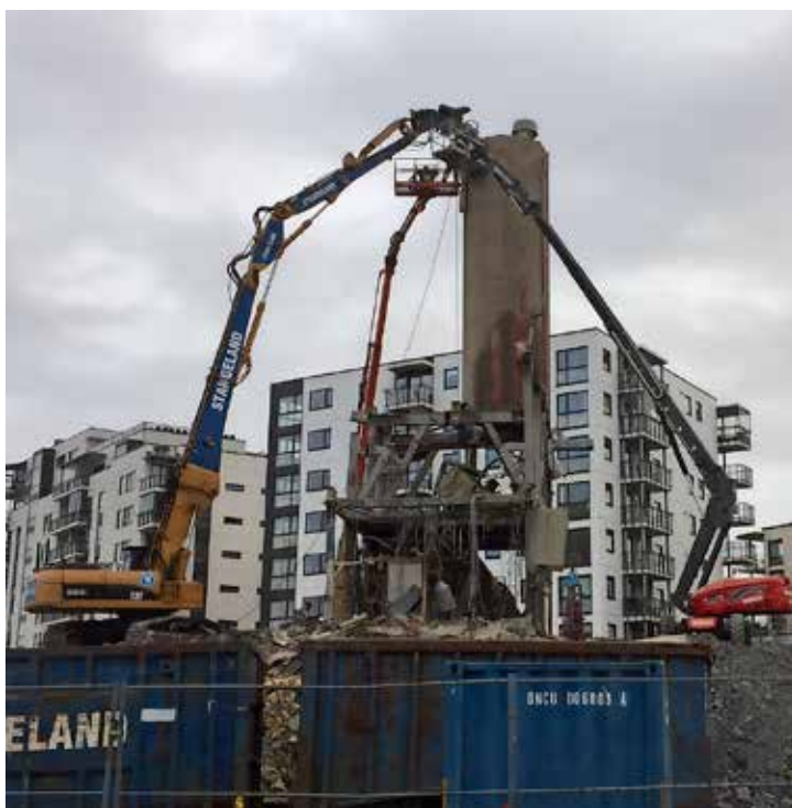
Riving av betongblandeverk på Lervig Brygge vest. Cat 330DL med langt riveutstyr samt 2 lifter i aksjon. Det ble festet en wire i toppen av stålsiloene og de ble dratt ned.

Betongsiloene med 42 meters høyde ble revet delvis med fjernstyrt riverobot og gravemaskin med riveutstyr. Det øverste 11 meterne ble meislet/tygget ned med riverobot. Her lagde vi en stålplattform som riveroboten stod på. Stålplattformen ble senket gradvis ned ettersom vi meislet/tygde oss nedover. Etter vi var ferdige med riveroboten rev vi resten med gravemaskin med langt riveutstyr.