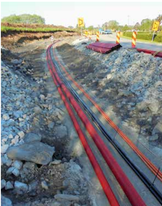
Ryddig og eksemplarisk utført kabelgrøft på prosjekt Fv. 327 Årsvollveien/Gimraveien.