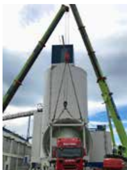
Godt samarbeid mellom Nordic Crane Midt og Einar Valde AS i Ålesund.

Nordic Crane Midt-Norge AS har en langsiktig strategi for en kontinuerlig fornyelse av maskinparken. I et marked der alle forventer kontinuerlig drift, ser vi at våre nye maskiner gir oss trygghet på at vi kan leve opp til vår