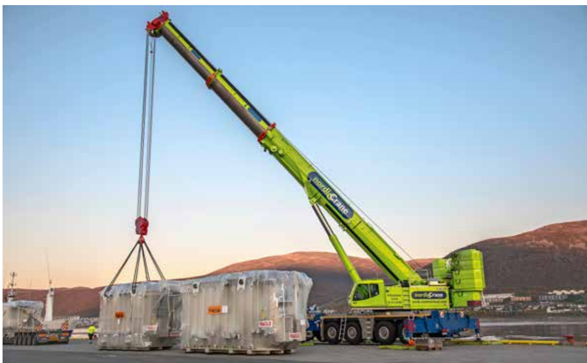
Tungløft for Nordic Crane Nord sin Tadano ATF 400G-6 på kaia i Tromsø.