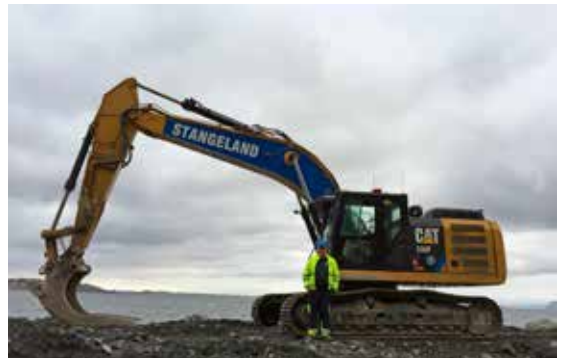
ARILD MUNTHE, CAT 330 FL