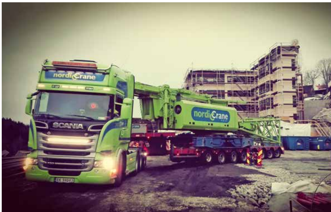
Flytting av 180 Tonns beltetkran på Kongsliå i Oslo.

Jeg ønsker alle kunder, leverandører, samarbeidspartnere, kollegaer og ansatte en god ferie etter hvert.