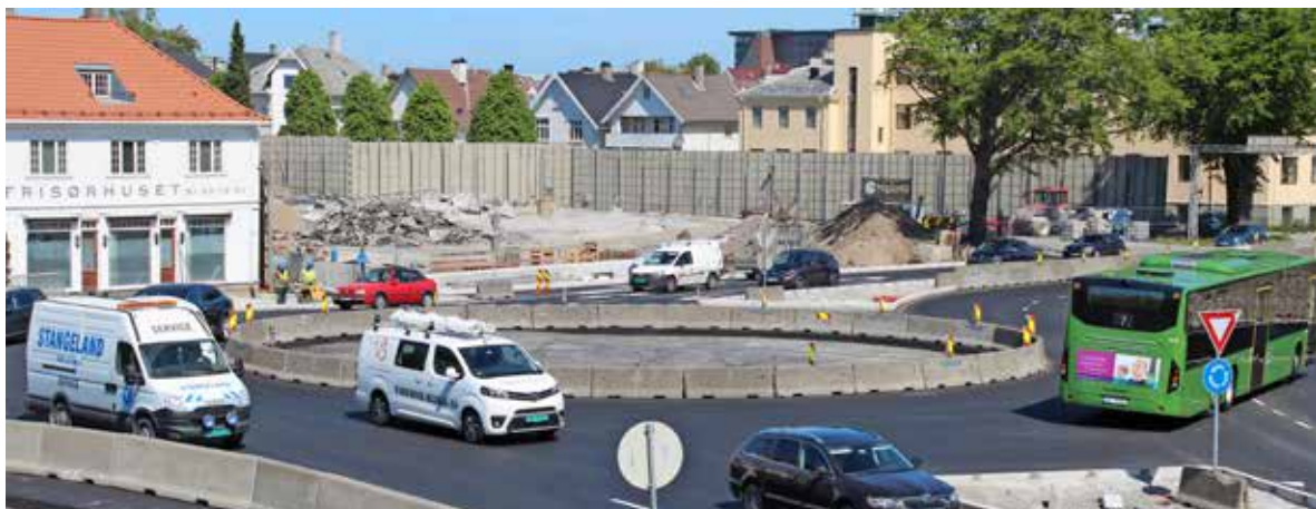
Rundkjøring: Den permanente rundkjøringen mellom Madlaveien og E39. Svithunparken i bakgrunnen.