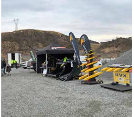
Flere leverandører stilte med flotte stander.

L ørdag 7. april hadde vi en fantastisk sosial og faglig dag på Kalberg. Mange leverandører stilte med maskiner for prøvekjøring. Vi fikk sammenligne maskiner, og hadde gode diskusjoner med de respektive leverandørene. Flere av de hadde stand med utstyr til gravemaskiner, slik som skuffer, forstykke/tenner, GPS og servicebil. Vi hadde rigget oss til med godt og varmt telt hvor det var benker og bord. Her var det to kjekke jenter som serverte kaffi, brus og wienerbrød. Ved inngangen til teltet stod det noen stødige karer fra Farstad Catering som grilltet ekte kjøttløser til oss. Takk til alle for en flott dag!