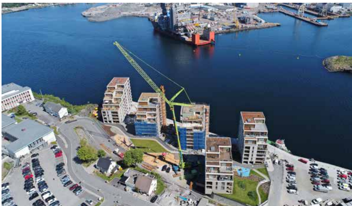
Demontering av tårnkran i innseilingen til Stavanger. Her måtte det en 500-Tonner til for å få jobben utført.

Vi ser frem til sommeren og høsten hvor prosjektene kommer tettere og arbeidsmengden øker. Vi er svært takknemlige for alle oppdragene vi får være med på og setter stor pris på våre oppdragsgivere. Ønsker alle sammen en god sommer.