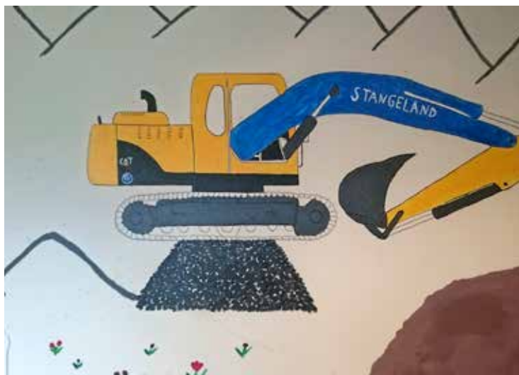
Kunst på veggen i barnehage. Anleggsarbeid sett med barns øyne.

Det gjøres mye godt arbeid for at Stangeland skal være en god nabo, noe av dette arbeidet kan du lese mer om i denne utgaven av TS-nytt. Les om godt samarbeid med grunneierne i Bjerkreim vindpark på side 12 og om vår nye elektriske gravemaskin på side 27. I Crane-nytt får du være med landet rundt å høre om nye flotte bygg, dyktige folk, toppmoderne utstyr og et marked i god balanse.