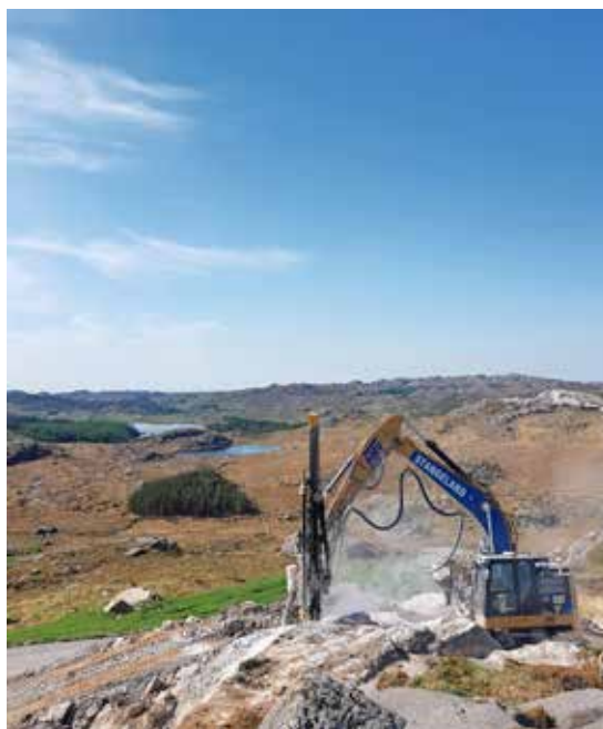
Flott landskap i Bjerkreim vindpark.