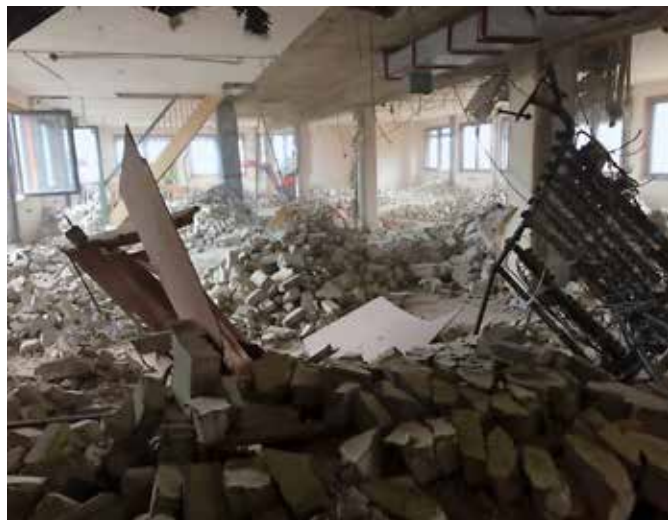
Innvendig riving av teglvegger på Hermetikkfagskolen i Stavanger.

LERVIG BRYGGE VEST. Rivearbeidene på Lervig brygge vest nærmer seg nå ferdigstillelse. Vår oppdragsgiver har vært Selvaag Bolig. Her har vi revet diverse lagerhaller, kontorbygg, betongblandeverk og høye siloer. Bygningsmassen bestod av cirka 4 800m 2 i grunnflate og betongsiloer med høyde på 42 meter over bakken.