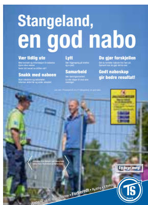
Vår interne plakate med viktige huskereglene om det å være en god nabo.

S tangeland, en god nabo står det på plakaten på kontordøra mi. Jeg har hengt den på innersida av døra, slik at det er lett å se den når jeg flytter blikket vekk fra PC-skjermen. Budskapet forplikter og er en fin påminnelse for oss alle i en travel arbeidshverdag, uansett hvor i firmaet vi jobber. Innholdet i budskapet er sterkt og viktig.