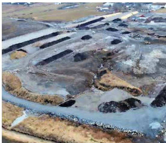
Dronefoto over Grasrotatippen fra mars 2018.

I Pukkverks-avdelingen er det som vanlig høyt trykk og mye å gjøre. Vi er kommet godt i gang med boring, sprengning og knusejobben for Veidekke i Sogn. Her har vi også bygget en anleggsveg fra bunnen av bruddet og opp til de øverste pallene. I skrivende stund er vi i akkurat kommet i gang med å knusingen i forbindelse med grunnarbeidene for trafostasjonen på Sauda, vi har også nettopp