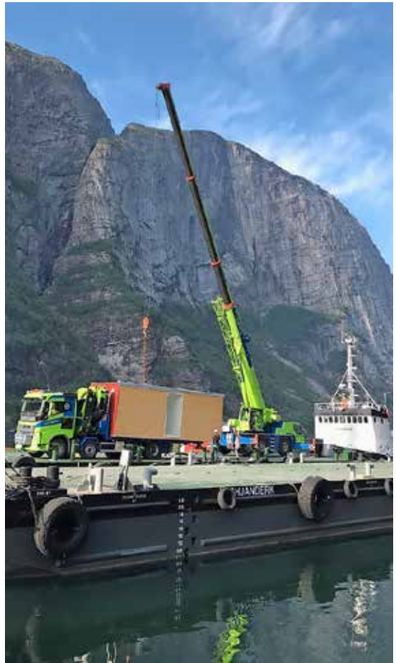
Super logistikk i forbindelse med brakkeflytting i Lysebotn.

Nå er det sommer og fint vær. Dette er en høyrisikoperiode for uønskede hendelser og skader. Varme og mye annet gildt som skjer, gjør at det er lett å glemme viktige moment for å sikre arbeidet og sørge for god HMS. Jeg oppfordrer