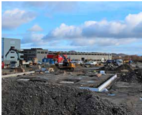
Stangeland Næringspark i april 2018.