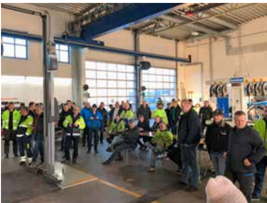
Klar til loddtrekning.