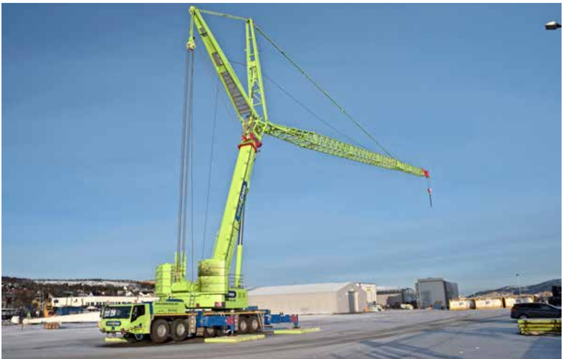
400-tonneren til Nord rigget med full jibb.

Jeg vil rette en stor takk til alle ansatte som har gjort en stor innsats med flytting samtidig som det har vært hektisk i driften. Nå er ferieavviklingen godt i gang. Vi vil ønske alle våre kunder, samarbeidspartnere, leverandører og ansatte en riktig god sommer.