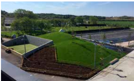
Ballbingen ligger fint plassert i skolegården på Ogna. Vi brukte ferdigplenn på gressvollen ned mot parkeringsplassen.