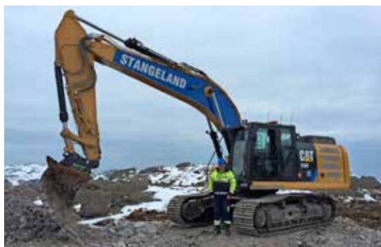
KARSTEIN GRØNNING, CAT 330 EL