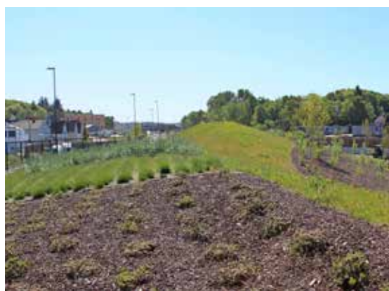
Kiellandsmyrå: Her var det en gammel søppelfylling som vi har erstattet med et flott grøntområde.

Vi er godt i rute til å ferdigstille alle våre arbeider til den kontraktsfestede milepelen i begynnelsen av desember 2018. Da vil veianlegget og tilstøtende grøntanlegg i dagsonen være 100 % ferdig.