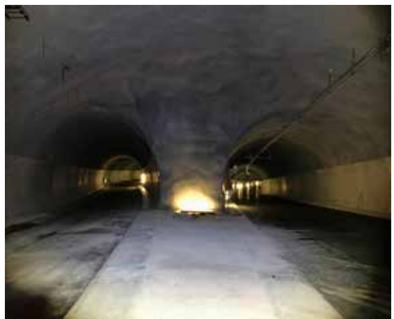
Inne i tunnelen.