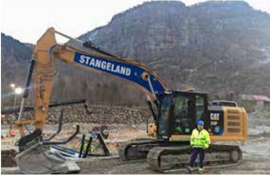
TERJE BREILAND, CAT 320F